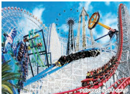
ナガシマスパーランド/イメージ