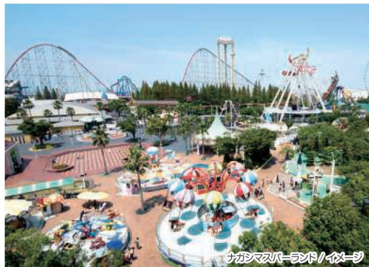
ナガシマスパーランド/イメージ